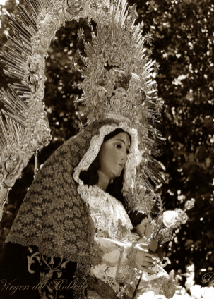
Virgen del Robles